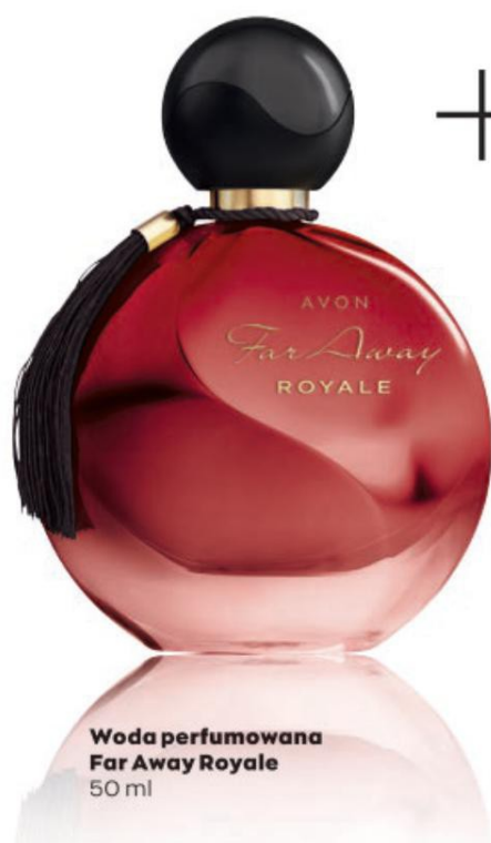
Woda perfumowana Far Away Royale 50 ml