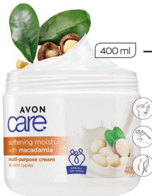
Uniwersalny krem do twarzy, rąk i ciała z orzechami makadamia 400 ml